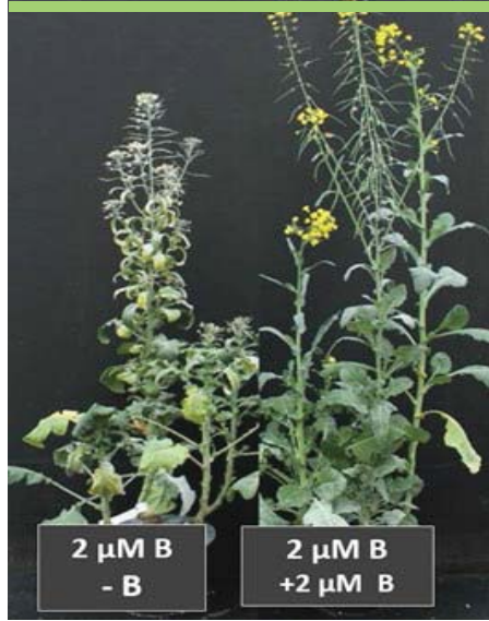
Resim 2. Kanola bitkisine beslenme çözeltilerinden rozetleşme [bolting] dönemine kadar 2 µM uygulandıktan sonra soldaki bitkilere tekrar bor uygulaması yapılmadı ve sağdaki bitkilere 2 µM bor uygulanmaya devam edildi [Çakmak ve Ark. 2022, yayınlanmamış sonuçlar].

Resim-1'de gösterilen denemelerde bitkiler çiçeklenme dönemine kadar büyütülmüş olsa, köklerde olduğu gibi generatif organlarda ve döllenmede de çarpıcı azalmalar ve hatta durmalar söz konusu olurdu. Gerçekten de generatif dönemde kolzada bor noksanlığının baş göstermesi durumunda çiçek organlarının gelişimi ve tohum oluşumunda önemli azalmalar ve hatta durmalar bulunmuştur [Resim 2]. Resim 2'de görüldüğü gibi, bor noksanlığı koşulları altında kolzada çiçek oluşumunun aksaması, çiçeklerin düzensiz gelişimi, oluşan çiçeklerin dökülmesi, döllenmenin ve tohum oluşumunun engellenmesi sıklıkla gözlenen belirtilerdir.