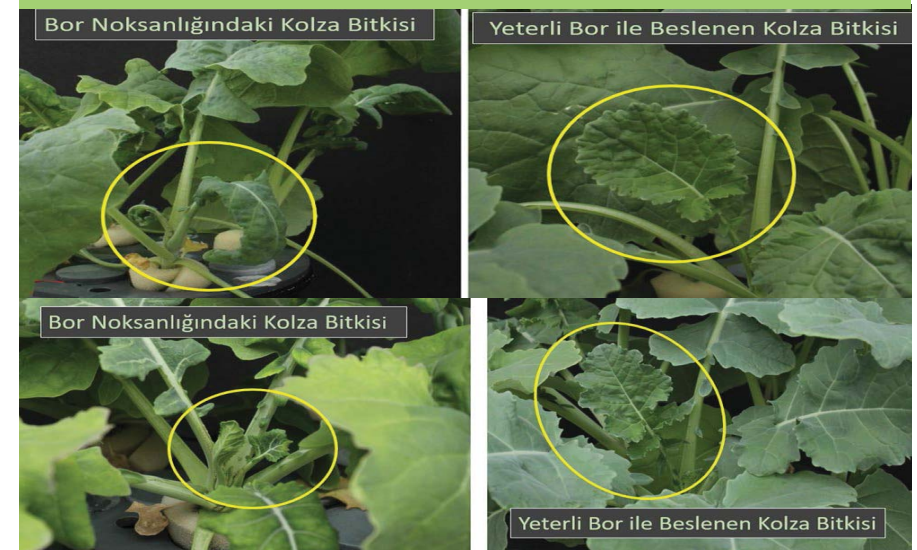
Resim 3. Bor beslenmesi yetersiz ve yeterli kanola bitkilerinin en genç yapraklarının büyüme ve gelişme durumu [Çakmak ve Ark. 2022, yayınlanmamış sonuçlar].

Kanola bitkisinde bor beslenme düzeyinin yaprak analizleriyle anlaşılmasında, analiz için seçilecek yaprak örneği çok önemlidir. Kritik bor konsantrasyonları örneklenen yaprakların yaşına göre büyük farklılıklar göstermektedir. Kökler tarafından alınan borun çok büyük bir bölümü, kanola bitkisinde floemdeki hareketsizliği nedeniyle yaşlı yapraklarda birikime uğrar. O nedenle bu tür yaşlı yapraklar bitkilerin B beslenmesinin düzeyini anlamada yetersiz kalır. Buna karşılık, halen büyüme aşamasında olan henüz olgunlaşmamış yapraklar ve büyümesini tamamlamış en genç yapraklar bor noksanlığının düzeyini belirlemede en güvenilir yapraklardır. Örneğin Resim 3'te gösterildiği gibi bor noksanlığında en genç yapraklarla büyüme noktasında şiddetli duraksamalar ve deformasyonlar söz konusudur. Bu sonuç en genç yaprakların bir altındaki daha olgun yapraklarda yeterli B olmasına karşın hemen ortaya çıkmaktadır. Yani olgun yapraklarda var olan bor, bor gereksinimi yüksek olan bitkinin genç kısımlarına taşınmamaktadır. Onun için kanola ve diğer birçok bitkide, bitkilerin bor beslenme statüsünü anlamak için yaprak örneklemede tercihen genç yaprakların örneklenmesinin önemli olduğunu göstermektedir.