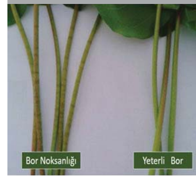
Resim 3. Bor noksanlığı koşullarında pamuk yaprak sapında görülen halka oluşumu [Li et al. 2017].

Pamukta bor noksanlığında yaprak sapları üzerinde kahverengi halkaların oluşması dikkat çekici bir başka noksanlık belirtisidir [Resim 3]. Bu halkaların bor ile beslenen bitkilere göre çok fazla sayıda olduğu görülmüş ve rapor edilmiştir. Bu belirtilerin arkasında fotosentez ürünlerinin yeterince yapraklardan taşınmamasının bir sonucu olduğu düşünülmektedir. Ancak bu sorunun da borun hücre duvarı sağlamlığı ve fonksiyonları üzerindeki etkilerle ilişkili olması olasıdır. Gerçekten de pamukta önemli bir destek organı olarak işlev gören yaprak sapı iletim demetlerinde bor noksanlığına bağlı değişiklikleri araştıran çok az araştırma bulunmaktadır. Örneğin, pamuğun yaprak saplarındaki hücre duvarı pektin içeriği ile bitki bor içeriği arasında ilişkinin olabileceği tahmin edilmiştir. Pamuk bitkisinde, yaprak sapında görülen bu halka oluşumu ve yoğunluğu bor noksanlığının önemli bir işareti olabilir ve üreticiler yaprak saplarına bakarak da bitkilerde bor noksanlığı olup olmadığını tahmin edebilirler.