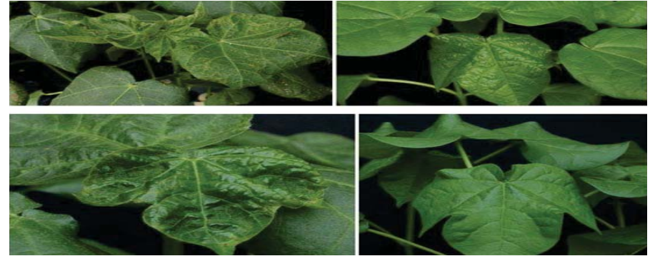
Resim 1. Pamuk bitkisinde bor noksanlığı [solda] ve yeterli bor beslenmesi [sağda] koşullarında genç yaprakların gelişimi [Çakmak ve Ark. 2022, yayınlanmamış sonuçlar].

Borun pamuk bitkisinde floem hareketliliği çok düşük olup, bor noksanlığı etkilerini daha çok hızlı büyüyen genç yapraklar, yeşil aksamın büyüme ve gelişme noktaları, lif gibi bitki organlarında gösterir. Benzer şekilde kökler de bor noksanlığına çok duyarlıdır. Genç yapraklarda şekil bozukluğu, küçülme, yer yer kahverengi ve sarı lekelerin görünmesi genelde ortak belirtilerdir [Resim 1]. Bor noksanlığında ayrıca genç yapraklar altındaki yaprakların koyu yeşil bir renk alması ve yaprak kenarlarının içeriye doğru büzülme göstermesi de sıklıkla rastlanılan belirtiler arasındadır [Resim 2]. Bor noksanlığındaki bitkilerde ayrıca meyve dallarının kısılması, meyve tutumunun zayıflaması, terminal tomurcukların canlılığını kaybetmesi, ölümü ve boğum aralarının kısılması da literatürde rapor edilmektedir. Bor noksanlığı altında meyve veya kozaların tabanında çatlaklar oluşabilir ve koza dökülmesi görülebilir. Bazı çalışmalarda, sıklıkla görülen koza ve çiçek dökülmesi, bor noksanlığı sonucu meyve ve çiçek bölgelerine karbonhidrat taşınmasındaki azalmaya bağlanmaktadır. Ancak bu olumsuz etkilerin, daha çok bor noksanlığının neden olduğu hücre duvarlarının oluşumu ve fiziksel bütünlüğündeki sorunlarla daha fazla ilişkili olduğu düşünülmektedir.