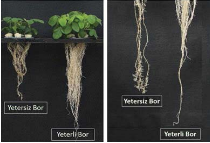
Resim 2. Yeterli ve yetersiz düzeylerde bor ile beslenen soya bitkilerinin kök büyümesi [Çakmak ve Ark. 2022, yayınlanmamış sonuçlar].

Diğer bitki türlerinin çoğunda olduğu gibi, soya bitkisinde de borun floem kanalında taşınmasının çok sınırlı olduğu bilinmektedir. Borun bitkide çok sınırlı olan taşınabilirliğinden dolayı, soya bitkisinde de hem toprak üstü hem de toprak altı aktif büyüme noktaları bor noksanlığına karşı aşırı duyarlılık gösterir [Resim 2]. Bor noksanlığının ilerlemesiyle köklerde giderek koyulaşma, kahverengine dönüşme ortaya çıkmakta ve kök uzamasında ve yan köklerin gelişiminde de ani durmalar görülmektedir.