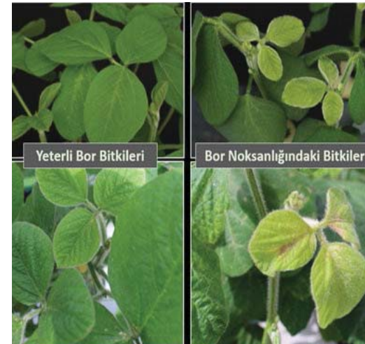
Resim 4. Yeterli ve yetersiz B ile beslenen soya bitkilerinin en genç yaprakları [Çakmak ve Ark. 2022, yayınlanmamış sonuçlar].

Bor noksanlığında kök uçlarındaki büyümenin durması gibi aynı zamanda yeşil aksamın büyüme noktalarında ve en genç yapraklarında da büyüme aktivitesi azalmakta ve durma noktasına gelmektedir. En genç yapraklarda nekroz ve sararmalar görülmekte, yapraklar büyümenin durması sonucu küçük kalmakta ve bazen de doku ölümleriyle dökülme göstermektedir [Resim 4].