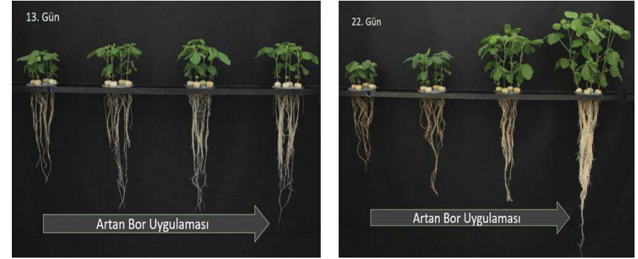
Resim 3. Artan oranda uygulanan B'un çimlenmeden sonra 13. ve 22. günlerde soya bitkisinin kök ve yeşil aksam büyümesi üzerine etkisi [Çakmak ve Ark. 2022, yayınlanmamış sonuçlar].

Bor noksanlığı ilerledikçe yeşil aksamda aktif büyüyen kısımlar da bor noksanlığından şiddetli biçimde etkilenmekte ve bitkinin yeşil aksam büyümesi önemli şekilde bir azalma göstermektedir [Resim 3]. Soyada noksanlığın şiddetlenmesiyle birlikte boyuna uzamada belirgin gerilemeler ortaya çıkmakta ve yeşil aksam biyomas üretimi azalma göstermektedir. Resim 3'te görüldüğü gibi bor noksanlığının ilk aşamasında [anılan denemede 13. günde] yeşil aksam büyümesinde köke göre azalmalar az görülürken, noksanlık problemi şiddetlendikçe [anılan denemede 22. günde] köklerde olduğu gibi yeşil aksam büyümesinde de çarpıcı düşüşler ortaya çıkmaktadır.